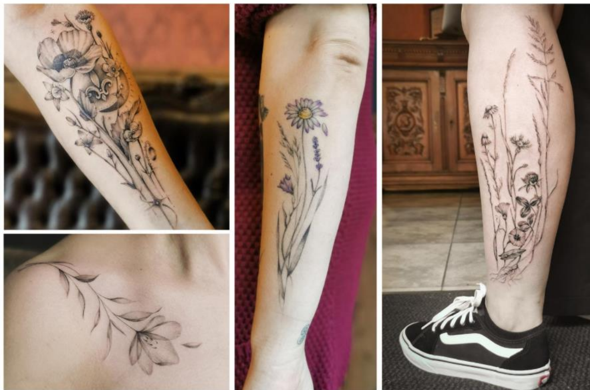
Tatuaże z motywem kwiatów.

W tatuażu są to różne kwiaty, a w grafikach na ubrania różnego rodzaju czachy, bo akurat głównie projektuję grafiki na koszulki dla zespołów muzycznych z klimatów cięższych brzmień.