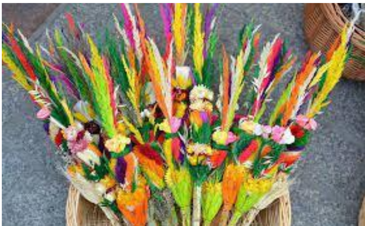
Zuzia Franków, klasa 6

Wierzono, że chroni domostwa przed nieszczęściami: wetknięta za świętym obrazem, umieszczona nad drzwiami czy na parapecie okna, miała chronić dom przed pożarem i powodzią, a domowników i żywy inwentarz, przed chorobami.