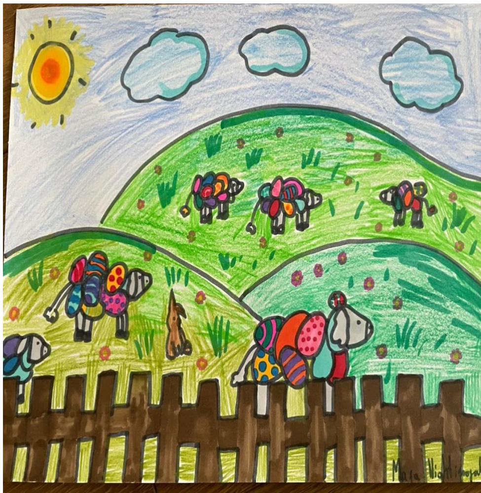
rys. Maja Nightingale, klasa 5