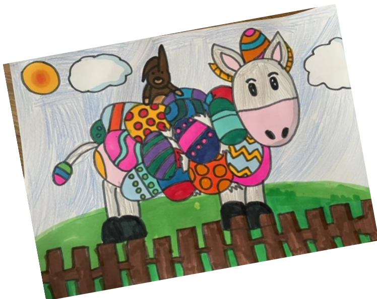
rys. Maja Nightingale, klasa 5