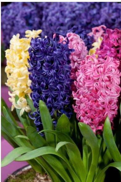
Hiacynt -naprawdę pięknie pachnie!

Hiacynty to urocze, cebulowe rośliny zachwycające nie tylko wyjątkowym wyglądem, ale również niezapomnianym zapachem. Hiacynty kwitną od kwietnia do maja. Ta roślina należy do rodziny szparagowatych.